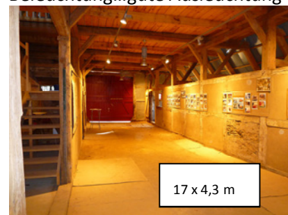
17 x 4,3 m