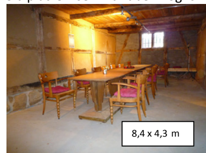
8,4 x 4,3 m