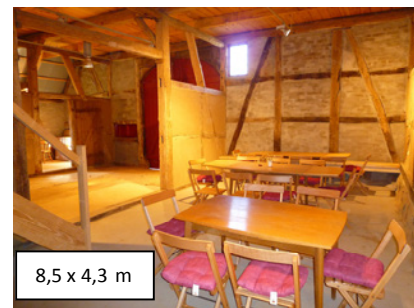
8,5 x 4,3 m

DER BÜRGERMEISTER Herbert Schmidt Krögers Moor 6 23911 Salem T.: 0 45 41 – 85 81 45; F.: 0 45 41 – 85 80 82; Mobil: 0170 73 19 300